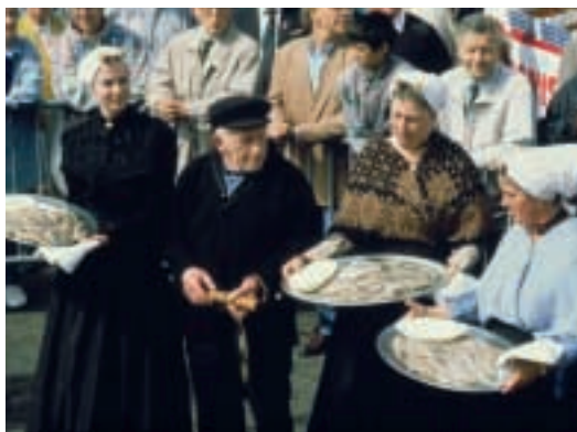
Die Eröffnung der Matjes-Saison zu feiern, ist auch in vielen deutschen Städten Tradition.

Den Freunden des original holländischen Matjes in Deutschland und den Niederlanden läuft jetzt wieder das Wasser im Mund zusammen. Seit Anfang Juni ist der neue Fang auf dem Markt. Die Matjes-Saison 2004 erfährt damit ihren Höhepunkt. Denn: Nur Heringe, die in der Zeit von Mitte Mai bis Ende Juni in den Gewässern der nördlichen Nordsee gefangen werden, können zum so genannten „Hollandse Nieuwe“, dem vorzüglich schmeckenden, neuen Matjes verarbeitet werden. Die Voraussetzungen zur Erzeugung von Spitzenqualitäten sind auch in diesem Jahr ausgezeichnet. Die Heringe haben sich in den vergangenen Wochen reichlich Körpermasse angefrassen, was den Fettgehalt auf optimale Werte um 20 Prozent und das Fettsäuremuster für eine besonders gesunde Ernährung in ein ideales Verhältnis